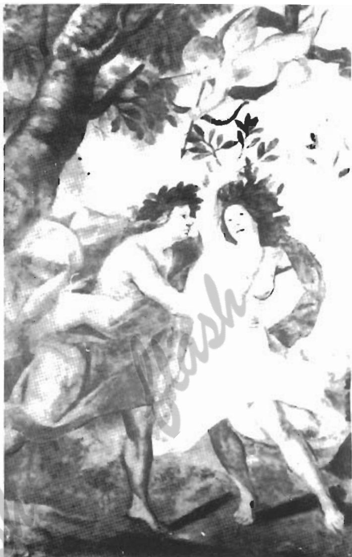
Dipinto di un soffitto.