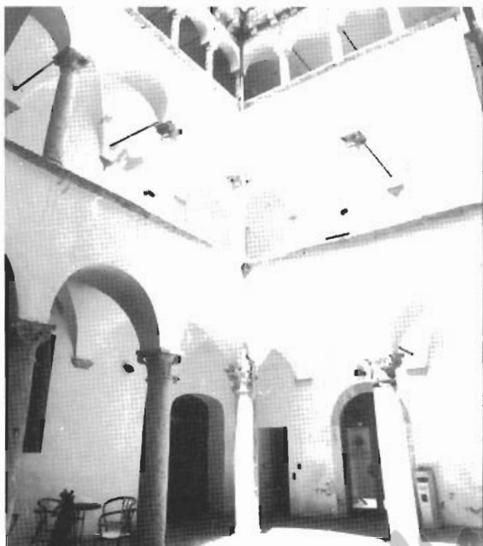
Palazzo Bonaccorsi: l'atrio dopo il restauro.

all'interesse e alla buona volontà dei proprietari Cavalletti, è stato riconsegnato alla città un edificio di notevole importanza storica con la stessa bellezza, splendore e maestosità di un tempo.